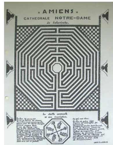
Kathedraal van Amiens met het labyrint in de kathedraal

In een aantal Europese landen w.o. Nederland (Maastricht) bevinden zich circa 32 kathedralen en kerken met labyrinten.