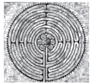
Kathedraal van Chartres met labyrint en pelgrims

Het woord 'kathedraal' heeft dezelfde oorsprong als het woord 'kathedr', wat 'troon' betekent. In de Middeleeuwen was de kathedr bestemd voor de zwarte madonna. Men zegt dat de madonna 'zwart' is omdat zij bij de aarde hoort, bij de vruchtbare duisternis van de aarde. In de crypte onder de kathedraal bevindt zich de zwarte madonna met haar kind. Uit hout gesneden. Op haar schoot zit haar zoon, niet een pasgeboren kind, maar een persoon met een rijp, tijdloos gezicht. Beiden hebben de ogen gesloten. Ook hij rust in zichzelf, even vredig sereen als zijn moeder. Samen zijn ze één. Het kind van de madonna is het zinnebeeld van de 'tweede geboorte'. De symboliek is dat wij de eerste keer letterlijk geboren worden (uiterlijk), de tweede keer in de geest (innerlijk). Wij worden dan als rijpe, zelfstandige mensen geboren. Wij worden in onze diepe identiteit geïnitieerd. En hierop heeft het labyrint betrekking. Het ultieme labyrint